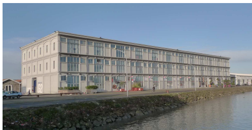
Hangar G2, Bassin à flot